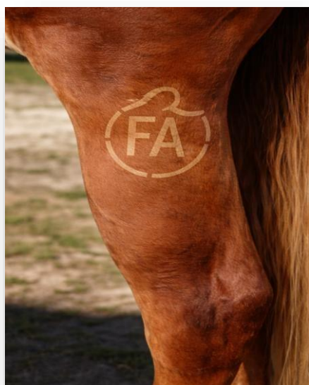
Marca en la Paleta o Pierna Izquierda