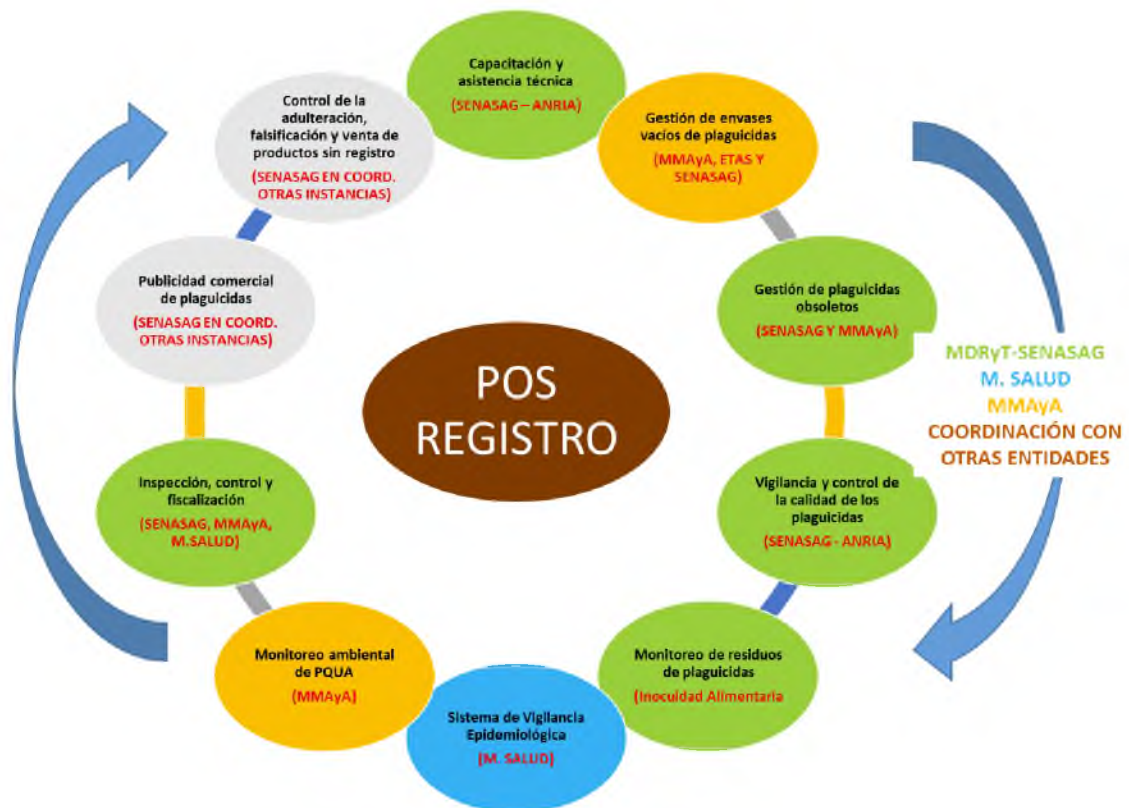
Grafico 1.- Flujoograma de control post registro

Control Post Registro son todas aquellas actividades posteriores al registro aplicables a los titulares de registro, importadores, fabricantes, formuladores, envasadores, distribuidores y comercializadores de productos formulados aprobados y registrados en el Registro Nacional de Plaguicidas Químicos de Uso Agrícola del SENASAG.