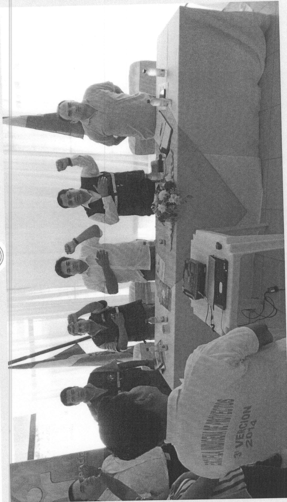
AUTORIDADES DEL SERVICIO NACIONAL QUE ASISTIERON AL EVENTO