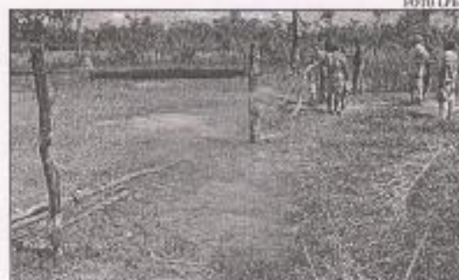
EN EL BENI TAMBIÉN HAY PROBLEMAS DE AVASALLAMIENTO.

Finalmente Rodríguez, dijo que con la Ley promulgada, recientemente, se pretende frenar el alto índice de avasallamientos que se estaban originando en varias partes del país.