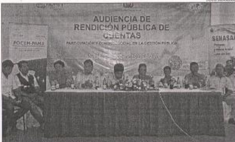
AUTORIDADES QUE PARTICIPARON EN EL ACTO ORGANIZADO POR EL SENASAG.

Entre los logros más importantes en sanidad animal se destaca, la certificación por