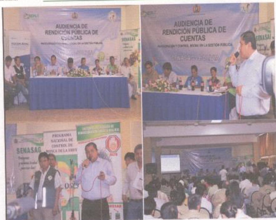
Fotos de la audiencia publica