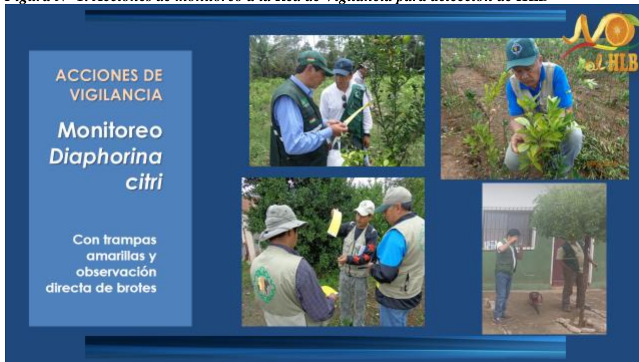
Figura N° 1. Acciones de monitoreo a la Red de Vigilancia para detección de HLB