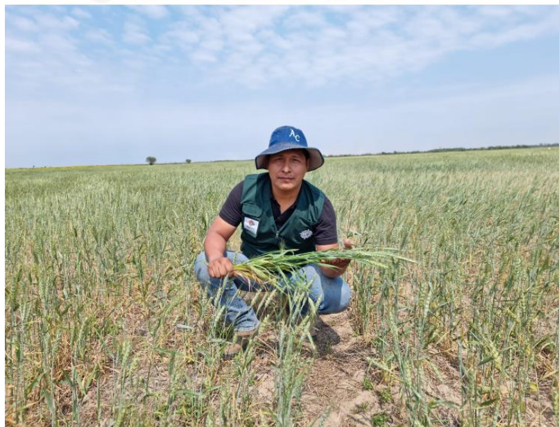
Identificación de insectos plagas en las prospecciones de campo al cultivo de trigo. Campaña invierno 2021.