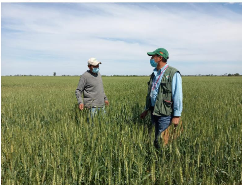
Prospecciones de campo a parcelas centinelas de la Red de Vigilancia Fitosanitaria en el cultivo de trigo. Campaña invierno 2021.