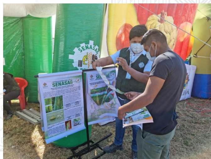
Participación del Equipo técnico del proyecto trigo en diferentes eventos de socialización de las acciones ejecutadas durante la gestión 2021.