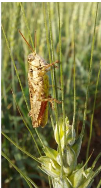
Figura N° 1y 2. Acciones de Prospección y conformación de la Red de Vigilancia del Cultivo de Trigo

MINISTERIO DE DESARROLLO RURAL Y TIERRAS