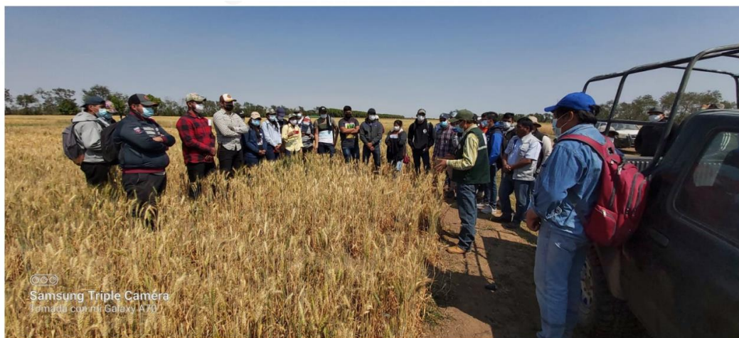
Capacitación en la temática de Vigilancia Fitosanitaria en el municipio de Pailón Campaña invierno 2021.